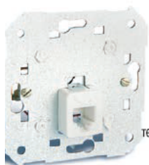
Схема подключения телефонных розеток для Серий Simon 27, 82 и 88